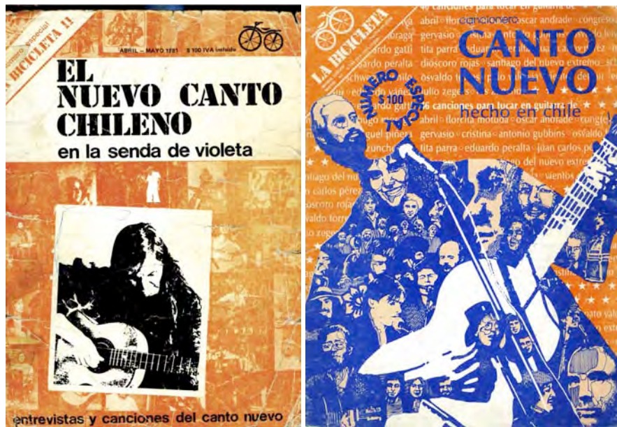
Imagen 4 y 5. Números especiales sobre Canto Nuevo (abril-mayo 1981; mayo, 1983)

medios de comunicación alternativa, esto es: la autonomía respecto a las empresas editoriales transnacionales, la búsqueda de un financiamiento no dependiente de la publicidad comercial, la propiedad colectiva del medio, y su deseo por aportar a la apertura de un espacio crítico en la sociedad (Richards, 1979: 79-80). A ello es necesario agregar también la búsqueda de un nuevo modo profesional de información, basado tanto en el periodismo y las ciencias sociales, como en un estilo de escritura que utilizaba la ironía, el humor y el relato literario como herramientas comunicativas. Este estilo de escritura, así como el carácter colectivo de la empresa y el sentido democrático de la revista, son evidentes en la leyenda editorial incluida al inicio de cada número: