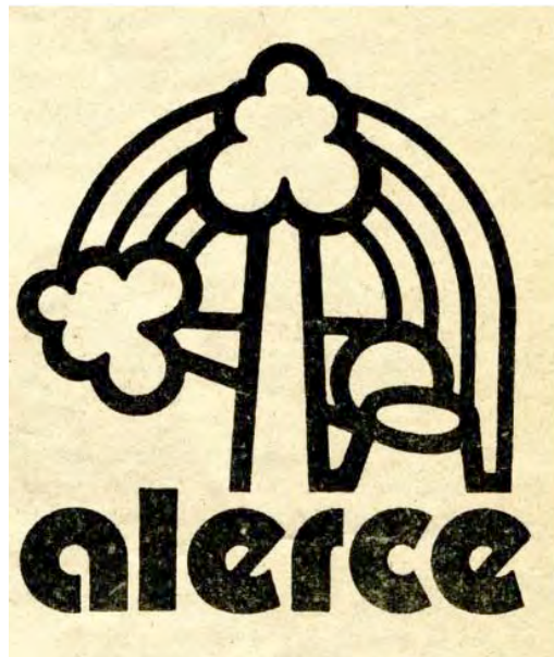
Imagen 1. Logo del sello Alerce. ( La bicicleta , abril-mayo 1981): 15

El giro operado en esta última frase, sin duda, nos plantea uno de los aspectos centrales en la elaboración de un discurso sobre los músicos populares surgidos en el período de la dictadura: ellos debían responder tanto a la necesidad de preservar una memoria social y musical, como a la dificultad de otorgar un lugar a "lo nuevo" al interior de esta memoria. Entre la herencia del pasado y la urgencia del presente, el Canto Nuevo será un modo de enunciación colectivo, condicionado por la necesidad de sobrellevar un silencio producido por la desaparición de sus referentes culturales. En este sentido, la función de la música popular y de la práctica colectiva del canto, fue la de construir una sutura en las memorias sociales: volver a otorgar sentido al presente, a partir de una escucha del pasado. En palabras de Patricia Díaz-Inostroza: "Con ello se intentaba cruzar una línea divisoria del tiempo y de los acontecimientos, claramente visible por parte de los protagonistas" (Díaz-Inostroza, 2007: 163).