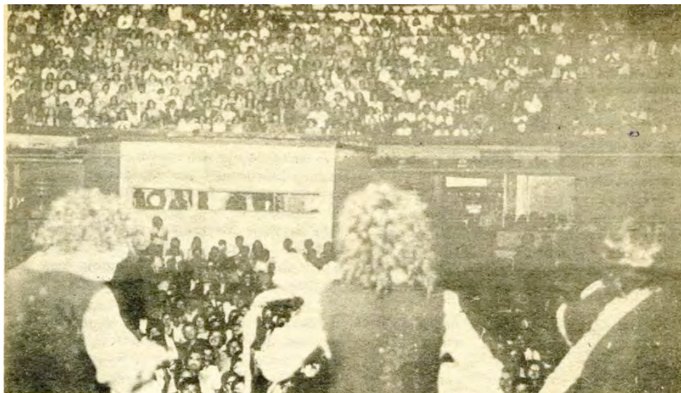
Imagen 3. Illapu en el Teatro Caupolicán ( La bicicleta , abril-mayo 1981): 12

Por otra parte, los Recitales Nuestro Canto organizados por la misma productora en los Teatros Cariola y Caupolicán para un público más masivo, ya no se limitaban a llevar la música popular a los espacios públicos, sino que ellos buscaban también, "ayudar al crecimiento artístico y profesional de los artistas del canto popular, planteando niveles de exigencia superior en estos espectáculos" (Ibid: 154). Esta promoción de los artistas populares a través de espectáculos profesionales, permitía al mismo tiempo articular un espacio de encuentro entre distintos sujetos (jóvenes